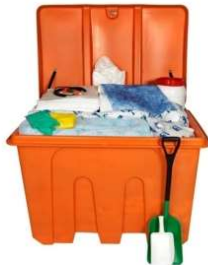
EKO SET – 1200 L